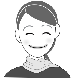
首元に明るい差し色を