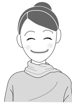
全体を明るい色に