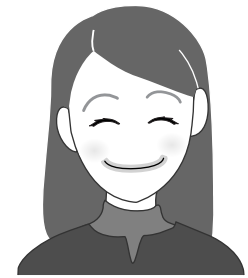
シックで暗めな色合い